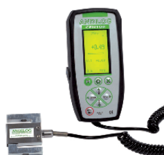
Display mit externer Kraftmessdose