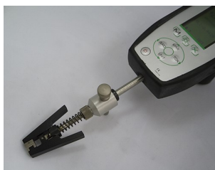
Kraftmessgerät mit internem Sensor