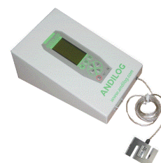
Tischdisplay mit externer Kraftmessdose